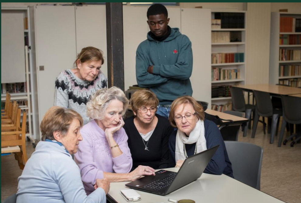
Permanences informatiques par et pour les seniors