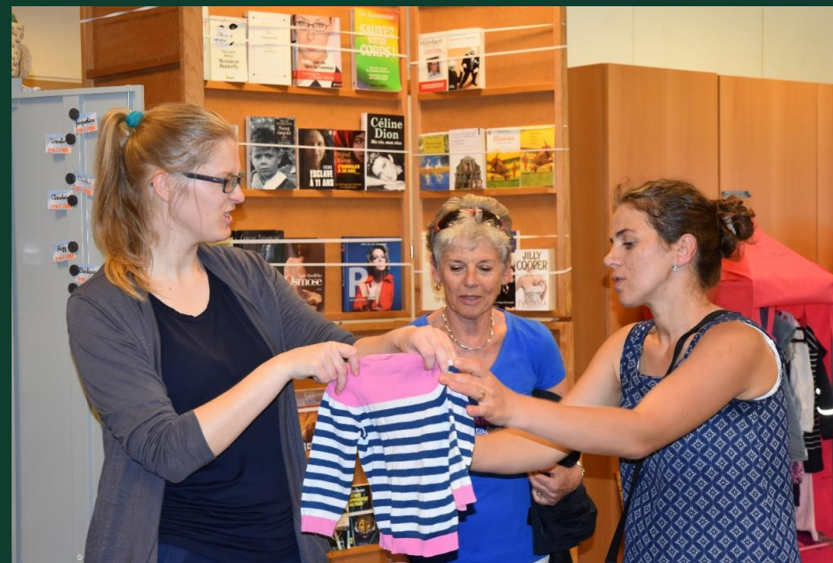
Boutiques de troc