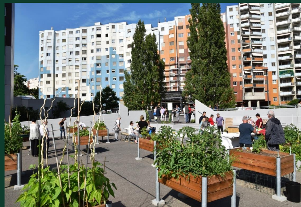
Jardins de l'amitié