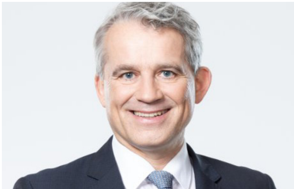
Beat Jans Président du gouvernement de Bâle-Ville et membre du comité de l'Union des villes suisses

Beat Jans a été élu au gouvernement de Bâle-Ville en novembre 2020 et dirige le Département de la présidence. Auparavant, il a siégé pendant 10 ans au Conseil national où il était membre de la Commission de l'environnement, de l'aménagement du territoire et de l'énergie.